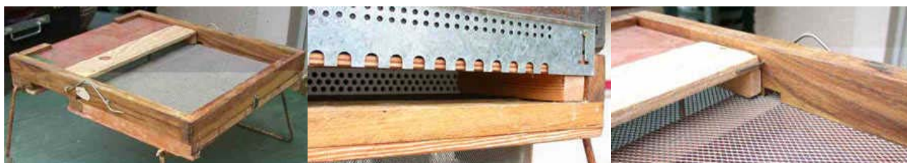
Top view - Vue de dessus